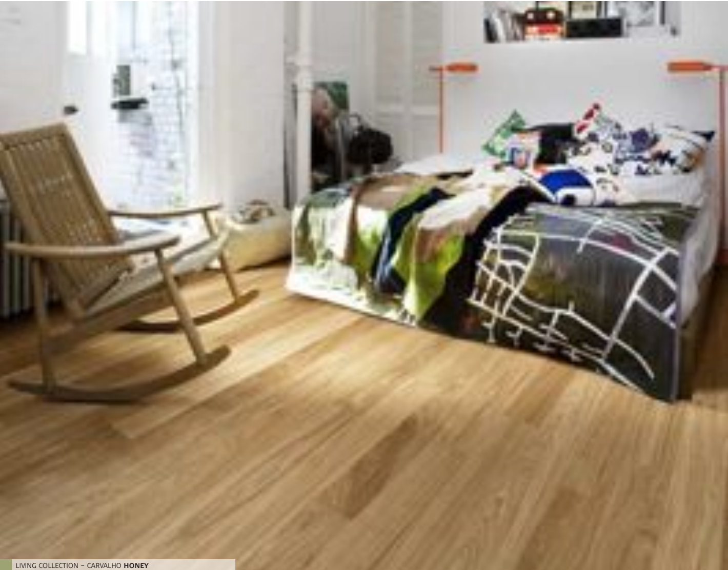
LIVING COLLECTION – CARVALHO HONEY

Clássica, porém moderna, a Linnea Living apresenta uma coleção de pavimentos de 1 lamela. São todos envernizados, alguns em verniz acetinado mate para um acabamento liso e outros com verniz mate para obterem um aspecto mais suave. Além disso, alguns pavimentos são igualmente escovados e micro-biselados. Nesta coleção irá também encontrar os nossos primeiros pavimentos Linnea com certificação FSC.