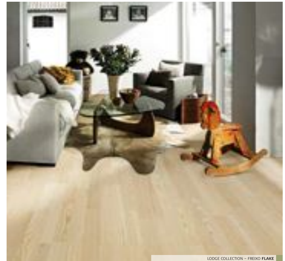
LODGE COLLECTION - FREIXO FLAKE