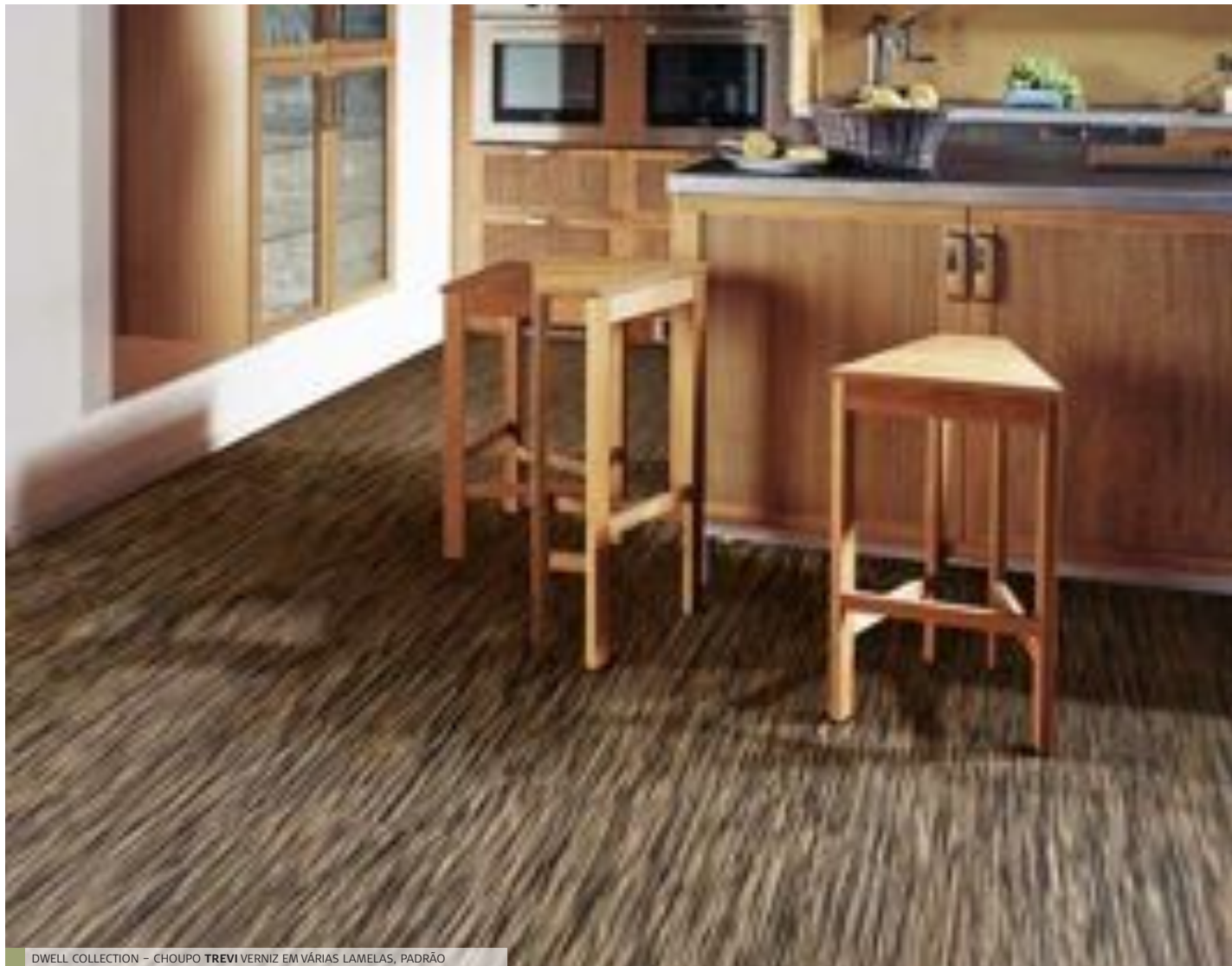
DWELL COLLECTION - CHOUPO TREVI VERNIZ EM VÁRIAS LAMELAS, PADRÃO