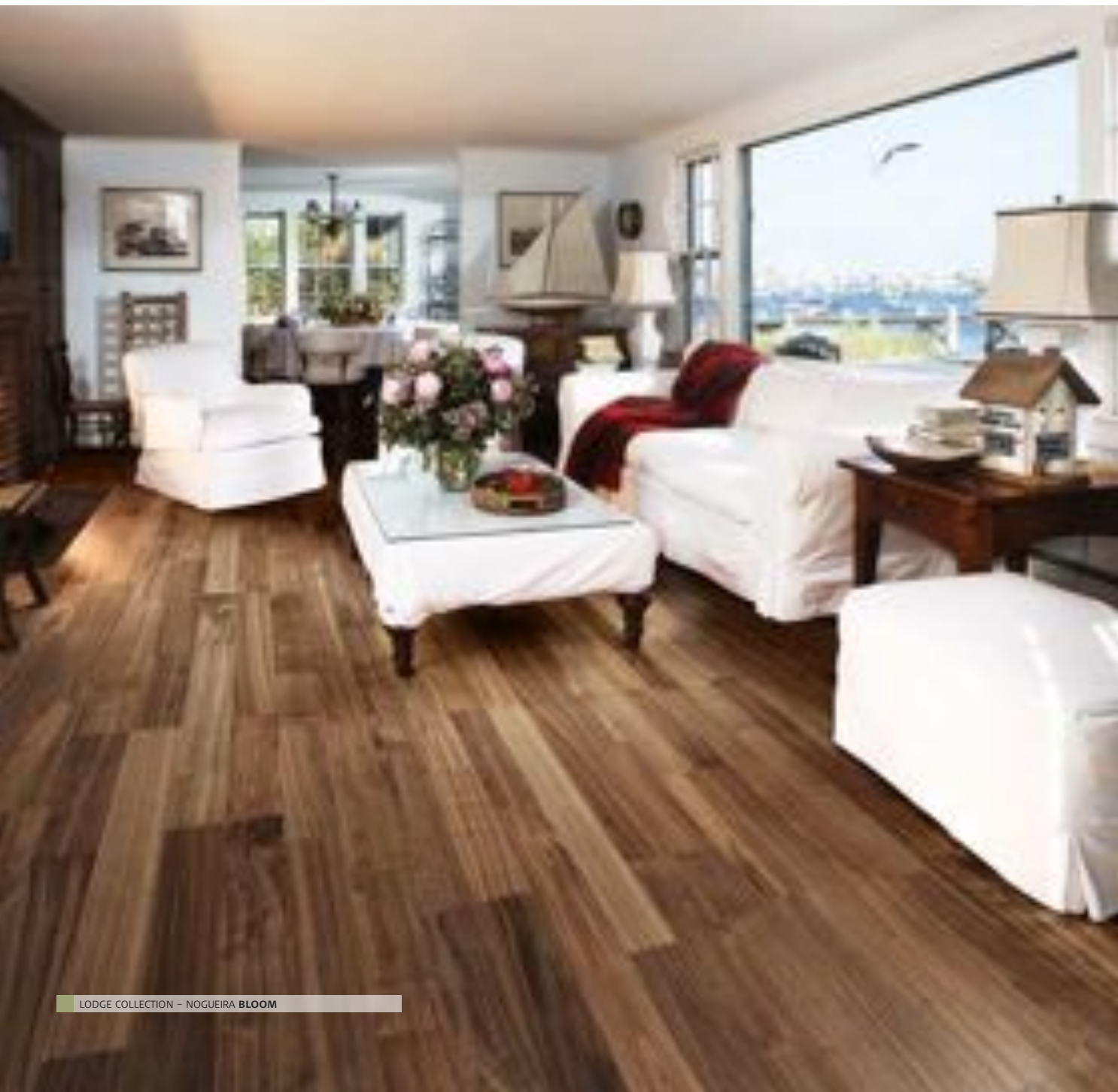
LODGE COLLECTION - NOGUEIRA BLOOM