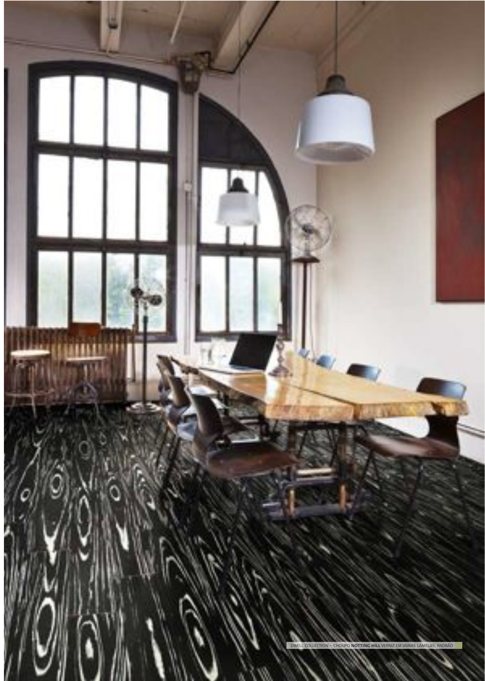
DWELL COLLECTION - CHOUPO NOTTING HILL VERNIZ EM VÁRIAS LAMELAS, PADRÃO