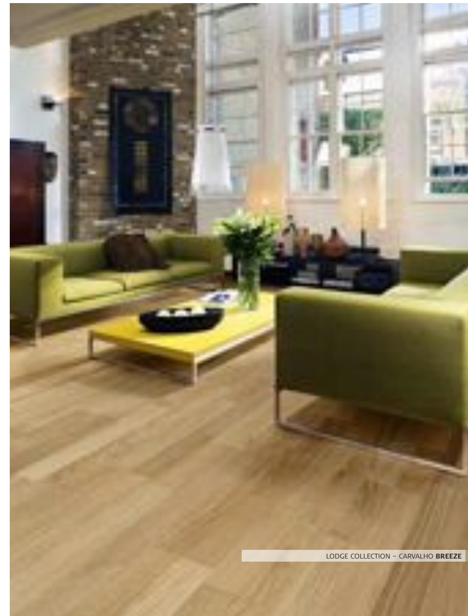
LODGE COLLECTION - CARVALHO BREEZE