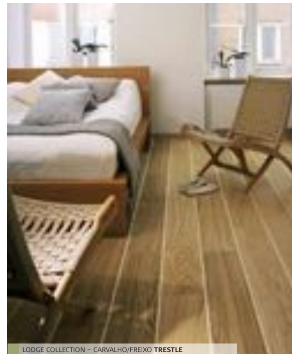
LODGE COLLECTION - CARVALHO/FREIXO TRESTLE

Se a sua casa é o seu castelo, opte por um pavimento da Linnea Lodge Collection. Esta colecção inclui uma série de pavimentos que vão desde a bétula mais pálida até ao carvalho clássico, e da quente cerejeira até à nogueira, um pouco mais escura. Se sonha dar um toque marítimo ao seu lar, não procure mais, pois esta colecção também inclui dois pavimentos estilo convés de navio. Consulte a página 23 para visualizar a gama completa