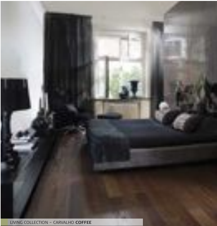
LIVING COLLECTION – CARVALHO COFFEE

Clássica, porém moderna, a Linnea Living apresenta uma coleção de pavimentos de 1 lamela. São todos envernizados, alguns em verniz acetinado mate para um acabamento liso e outros com verniz mate para obterem um aspecto mais suave. Além disso, alguns pavimentos são igualmente escovados e micro-biselados. Nesta coleção irá também encontrar os nossos primeiros pavimentos Linnea com certificação FSC.