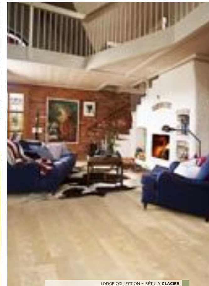
LODGE COLLECTION - BÉTULA GLACIER