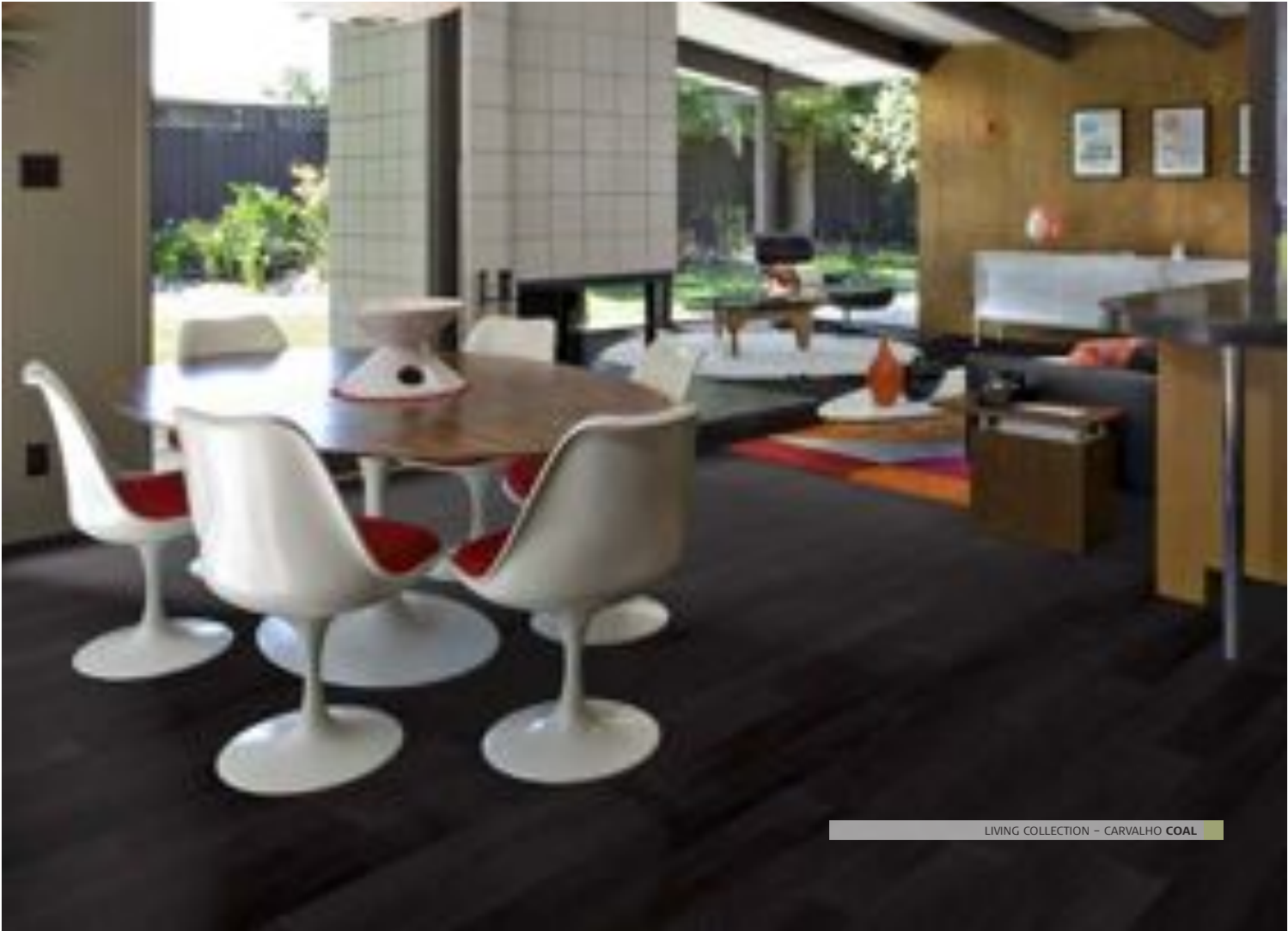
LIVING COLLECTION – CARVALHO COAL