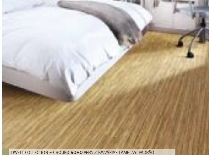
DWELL COLLECTION - CHOUPO SOHO VERNIZ EM VÁRIAS LAMELAS, PADRÃO

Foram adicionados quatro inovadores pavimentos com várias lamelas à Dwell Collection, em cores que vão desde a madeira pálida, natural, até ao dramático preto e branco. Estes pavimentos proporcionam certamente drama e glamour à sua casa.