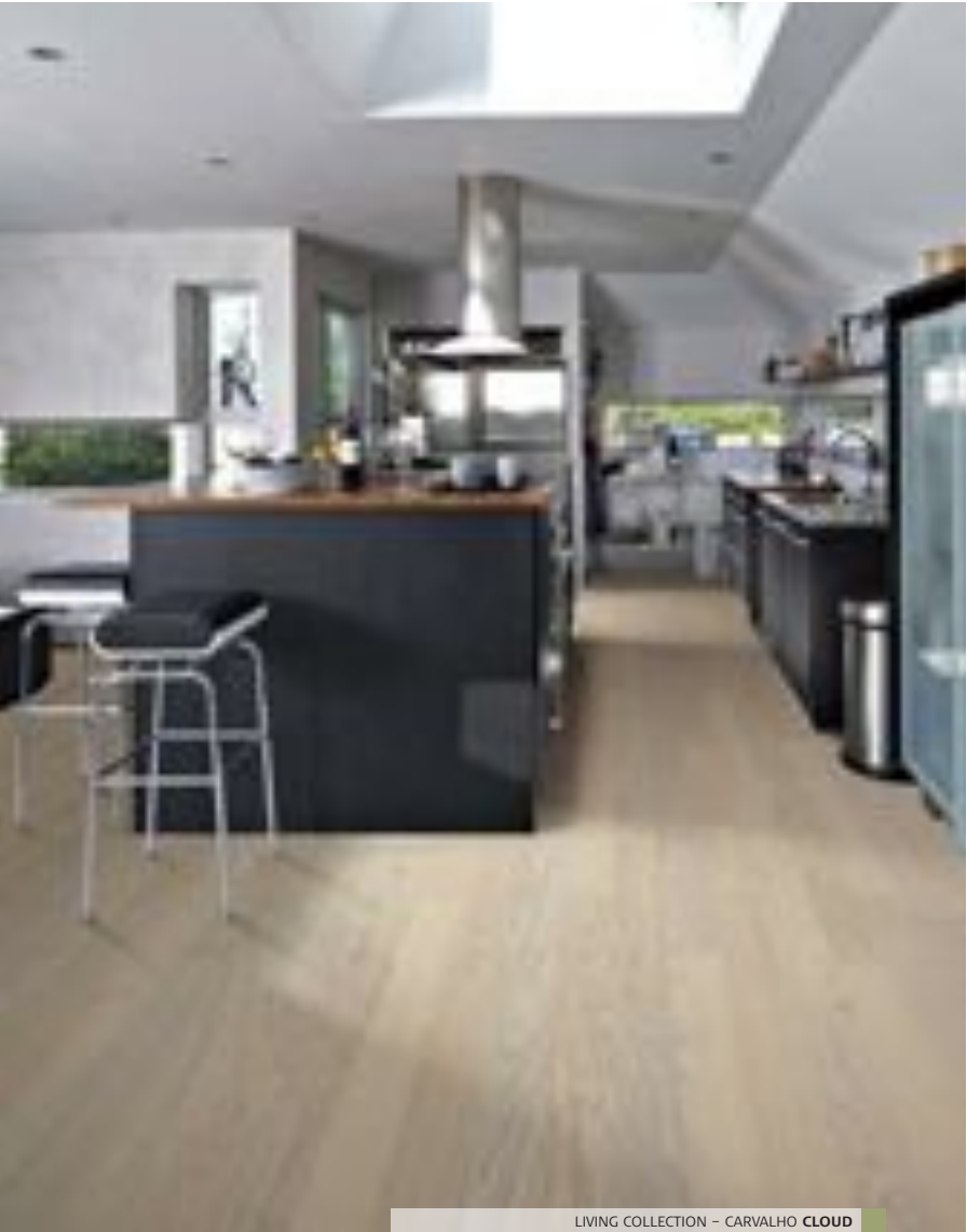
LIVING COLLECTION – CARVALHO CLOUD