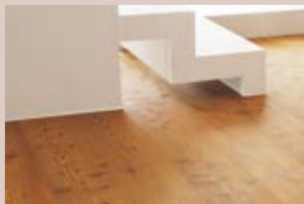
Soalho de Riga Natural com acabamento Cognac