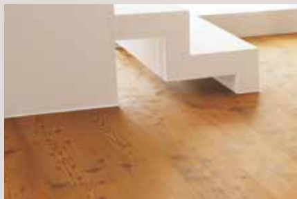
Soalho de Riga Natural com acabamento Cognac